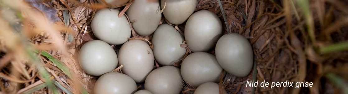
Nid de perdrix grise