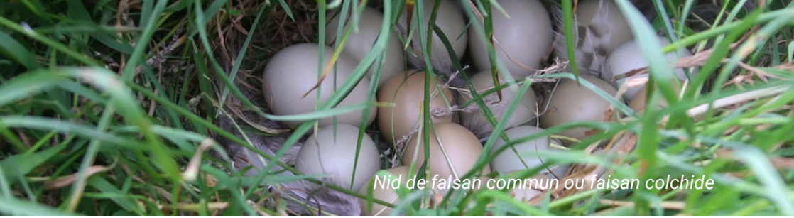
Nid de faisán commun ou faisán colchide